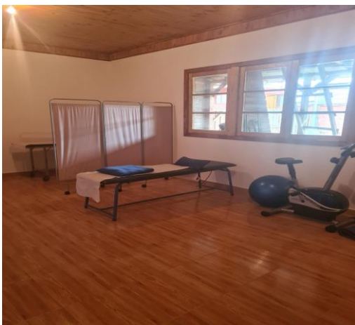
Nueva sala implementada atención

Teníamos ya algunos implementos comprados con la generosidad de algunas personas, como camillas, sillas, biombo, entre otros. Solo tuvimos que adquirir algunos elementos de atención propios de estos menesteres y comenzamos.